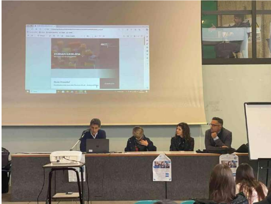
(durante l’esposizione all’istituto Pandini)

Attraverso la proiezione di slides, preventivamente da noi predisposte, abbiamo illustrato e commentato e resi edotti gli studenti circa il percorso del Geometra per divenire libero professionista, praticantato e successivo esame di Stato oppure largo spazio è stato