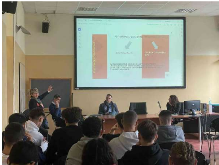
(durante l’esposizione all’istituto Agostino Bassi)

dedicato alla possibilità di intraprendere il percorso universitario per conseguire la laurea LP01 (Geometra Laureato), abilitante e riconosciuta anche in Europa. Successivamente è stata presentata la figura professionale del Geometra ed i suoi molteplici ambiti e settori di cui si occupa.